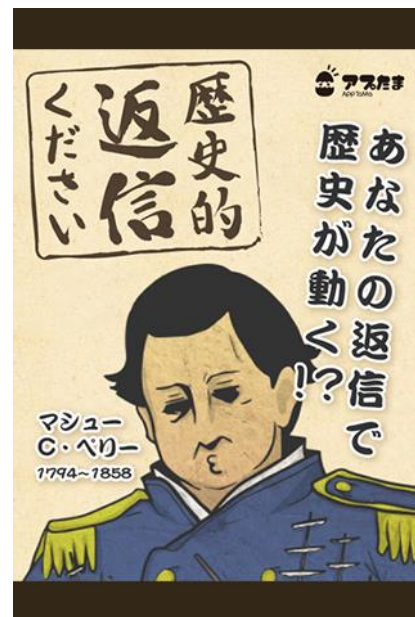
▲トップイメージ画面